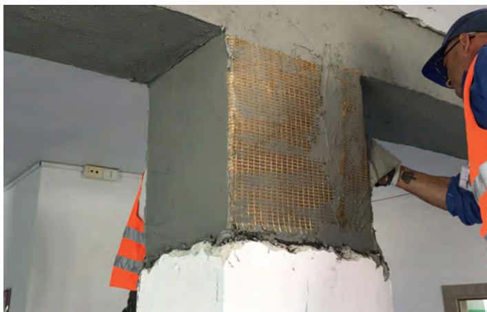
Rinforzo strutturale dei nodi Trave-Pilastro con FRCM in fibra di PBO.

Le analisi strutturali hanno dato modo di verificare che la maggiore carenza nei confronti della sicurezza strutturale è data dall'acciaio presente, tanto nei pilastri quanto nelle travi: si sono quindi individuati gli elementi strutturali che necessitavano di rinforzo e si è determinata, in via quantitativa, la carenza in termini di capacità dell'elemento. Per gli elementi strutturali individuati sono state poste in essere cerchiature e confinamenti con rinforzi in PBO in grado di incrementare la capacità resistente dell'elemento. Inoltre, sempre utilizzando reti in PBO, per le travi è stata prevista un'integrazione dell'armatura esistente resistenti a flessione e taglio.