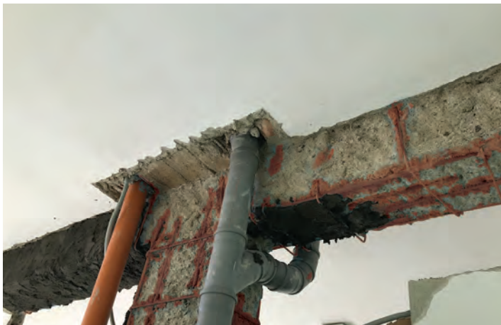
Preparazione del supporto, pulizia e posa del Passivante (malta a base di leganti cementizi anticorrosiva per la protezione dei ferri di armatura)